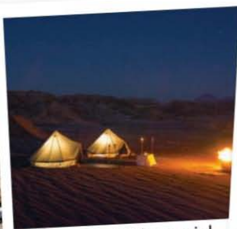
2 Sous le plus beau ciel du monde