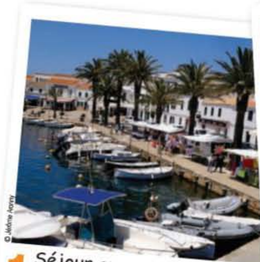
1 Séjour au Can Faustino