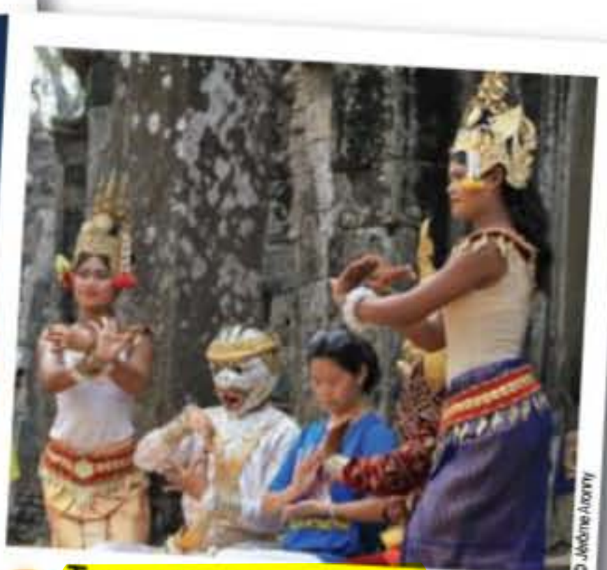
3 Immersion au pays du sourire