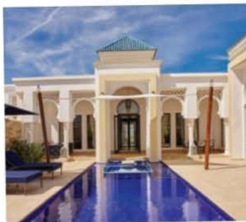
5 Détente au Banyan Tree Tamouda Bay