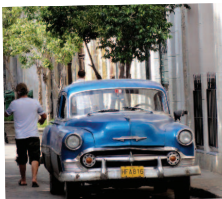
5 Douceur Caraïbes à la Baie des Cochons