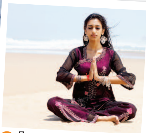
3 Zen attitude à Pondichéry