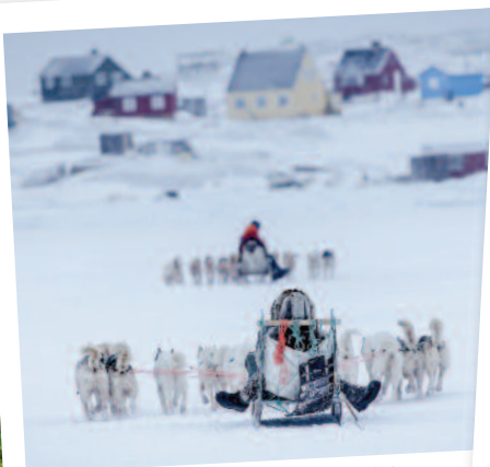
2 Raid en traîneau à chiens dans l'Arctique